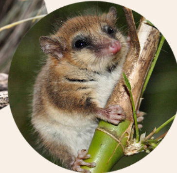
MONITO DE MONTE